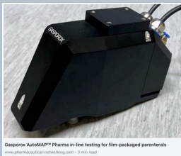
Gasporox AutoMAP™ Pharma in-line testing for film-packaged parenterals www.pharmaceutical-networking.com 3 08/2023