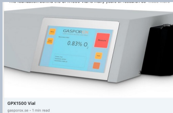
GPX1500 Vial gasporox.se - 1 min read